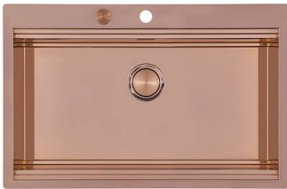
Lavello Milanello Copper workstation 1034 058