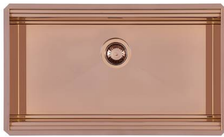
Lavello Milanello Copper Workstation 1034 858