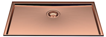
Lavello Phantom Base Copper 5557 148